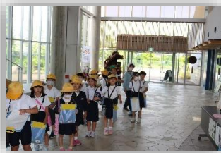
市民センター見学