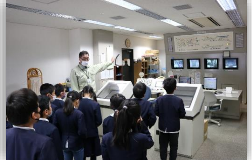
4年生：清掃センター見学