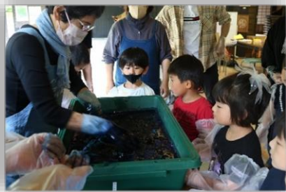
幼稚園：ささやまの森公園で藍染体験

丹波篠山市では、地域素材を活かした地域の人々とのふれあいを通して、子どもたちが伝統、文化、自然、産業、食文化等を学び、ふるさとへの誇りと愛着心を育む「ふるさと教育」を推進しています。本校園においても、子どもたちが現地に出かけて見学したり観察したり、地域の方から直接お話をさせていただいたり指導していただいたりする活動の機会を大切にしています。