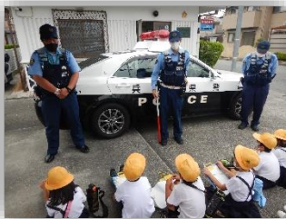
2年生：篠山交番見学