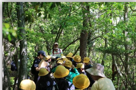
5年生：クリンソウ観察