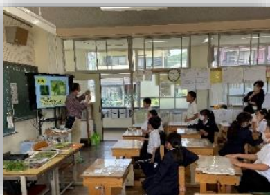
3年生：オオムラサキ学習