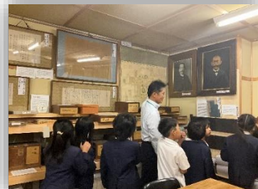
3年生：篠山鳳鳴高校見学